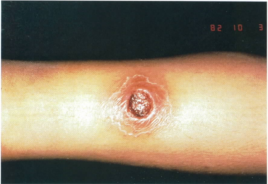
Figuur 1. Een typische zweer ten gevolge van cutane leishmaniasis met het aspect van een vulkaankrater.