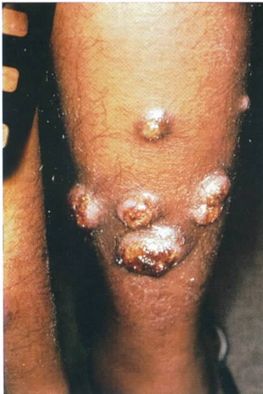
Figuur 2. Een cluster van nodulaire zweren op het onderbeen.

van het lichaam maakt dat er uiteindelijk een zweer (ulcus) ontstaat door necrose (figuur 1). Van oudsher spreekt men bij zweren opgelopen in het Midden-Oosten van een "Oriental sore". Er kunnen meerdere zweren tegelijk aanwezig zijn door versleping via lymfebanen maar ook door beten van meerdere zandvliegen, die elk zich tot een zweer kunnen ontwikkelen, tot tientallen tegelijk toe. Meestal is er dan sprake van clustering (figuur 2). Met name patiënten met diabetes mellitus hebben vaak multiple zweren. De zweer kan de vorm van een vulkaan krater aannemen (figuur 1) of een meer nodulaire vorm (figuur 2). Wat boven het niveau van de huid uitkomt is nog vaak maar een klein gedeelte van de totale laesie (ijsbergfenomeen). De zweer volgt de huidlijnen; dit is karakteristiek voor deze aandoening, evenals de satellietlesies die aan de rand van de zweer ontstaan. Een bijzondere lokalisatie is een zweer op de oorschelp, wat veel bij gumtappers in Midden-en Zuid-Amerika wordt gezien (Chiclero's ulcer) en wat tot ernstige misvorming en destructie van de oorschelp kan leiden. Andere bijzondere plaatsen zijn de lippen (cheilitis) of de vingers (dactylitis). De patiënt is niet ziek van de aandoening, maar ervaart de als maar niet genezende zweer als